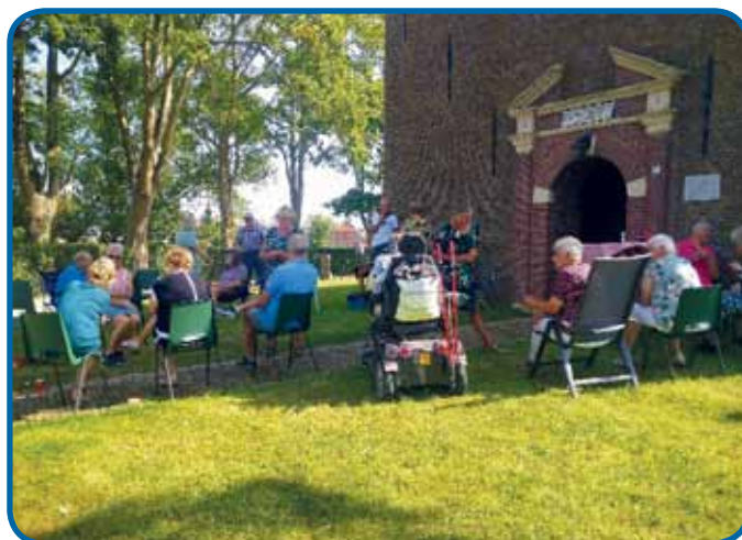
Koffiedrinken in Coronatijd